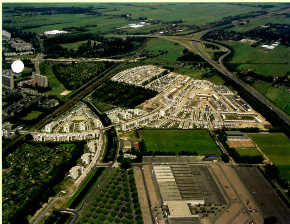
De drie volkstuincomplexen bij Voordorp in 1992. Linksonder De Pioniers, in het midden (bijna geheel omsloten door bebouwing) Ons Buiten en links daarvan De Driehoek. Rechtsonder het Veemarktterrein.

In de loop der jaren zijn de banden tussen het Tuinenpark Ons Buiten - zoals de vereniging sinds 2010 officieel heet - en de wijk Voordorp steeds nauwer aangehaald. Veel Voordorpers komen naar Ons Buiten voor een wandeling langs de siertuinen. Ook is er een dierenweide die vooral kinderen trekt. De percelen kweekveld die bestemd zijn voor het telen van groenten en bloemen, kunnen mede door belangstellenden uit de wijk worden gehuurd. Een ander gedeelte van het kweekveld wordt gebruikt voor schooltuintjes. Daarmee lijkt het voortbestaan van Ons Buiten voor de komende tijd gewaarborgd.