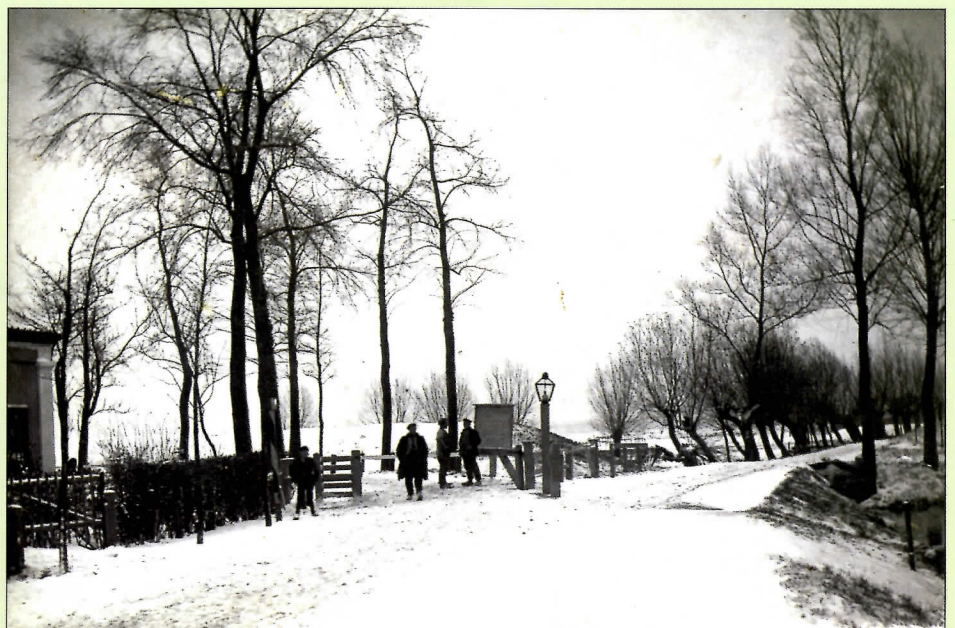
De Ezelsdijk omstreeks 1910. Links is nog net het tolhuisje te zien, achter het tolhek begint de weg naar fort Blauwkapel. Op deze plaats ligt nu het Eykmanplein.

ontstond in 1913 het eerste Utrechtse volkstuinencomplex, toen nog gelegen op het grondgebied van de gemeente Maartensdijk. Opmerkelijk was wel dat de fractie van de Sociaal Democratische Arbeiderspartij (SDAP) in de gemeenteraad had tegengestemd, omdat die van mening was dat de arbeiders - in plaats van een substantiële verbetering van hun leefomstandigheden te verkrijgen - nu werden afgescheept met een tuintje dat zij ook nog in hun schaarse vrije tijd moesten bewerken. Het terrein aan de Blauwkapelseweg had aanvankelijk een grootte van circa 2,5 hec-