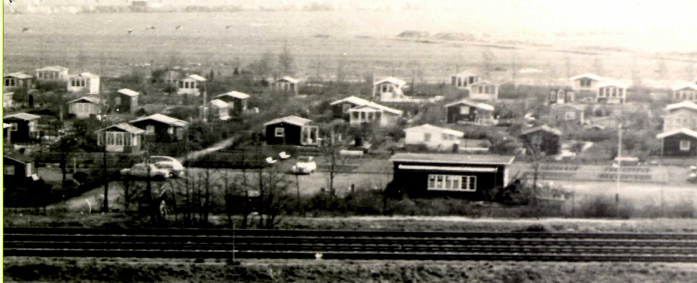
Overzichtsfoto van Ons Buiten eind jaren 60, genomen vanaf een flatgebouw aan de Winklerlaan.

□ COLLECTIE ARCHIEF TUINENPARK ONS BUITEN