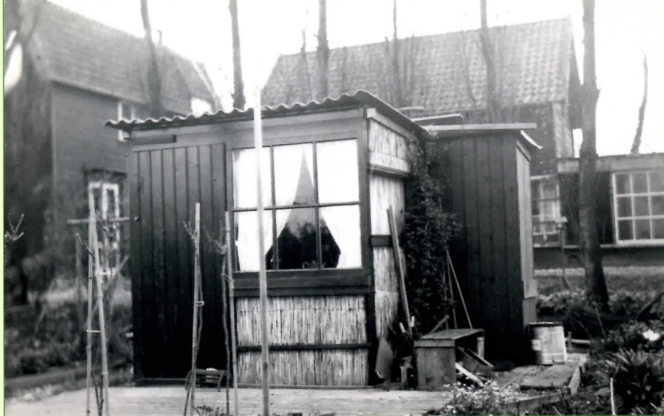
Een tuinhuisje op Ons Buiten in de jaren dertig, met op de achtergrond enkele houten huizen aan de Ezelsdijk