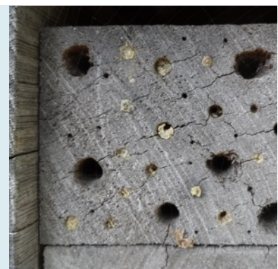
bijenmuur met nog dichte gangetjes

In de folder 14 slimme tips voor een groene vogeltuin vermeldt de Vogelbescherming enkele dingen die nog niet in dit blad aan de orde kwamen: Maak van een schaal een ondiepe vijver (kunnen insecten en vogels uit drinken), plant een stekelstruik zoals meidoorn of vuurdoorn (kunnen vogels veilig in nestelen), maai gras zelden en laat blad liggen in perkjes (kunnen insecten van profiteren en dus ook vogels).