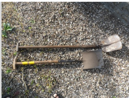
nieuw gesteelde schoppen