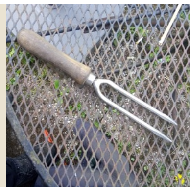
de wiedvork is gevonden!